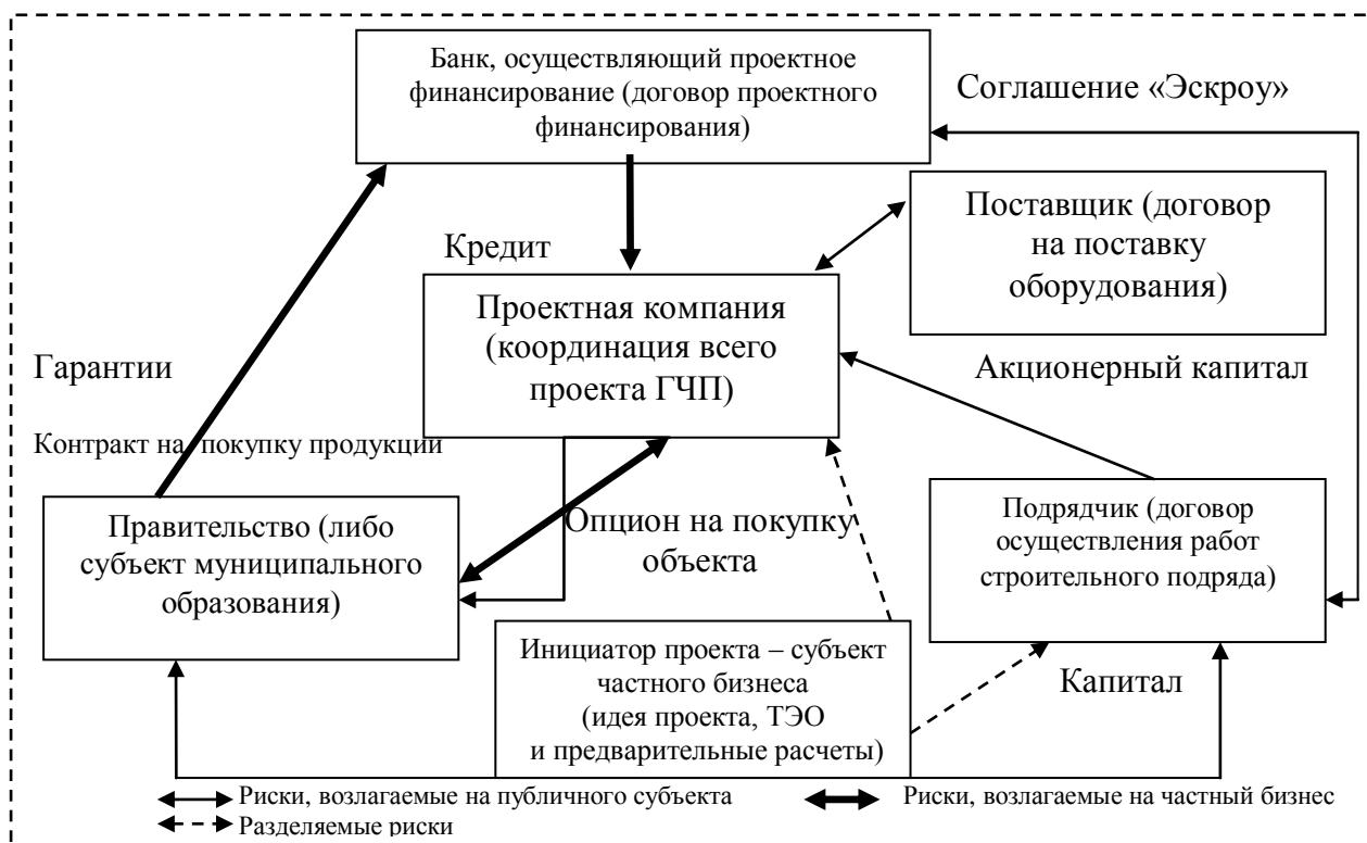
Рис. 1. Оптимальная форма кредитно-инвестиционного механизма в развитии проектов государственно-частного партнерства [авторская разработка]

исследовании базовой схемы концессии обоснована наиболее оптимальная форма кредитно-инвестиционного механизма в развитии проектов государственно-частного партнерства, учитывающая структурно-логическую связь между оценкой риска и источником его возникновения с целью принятия инвестиционного решения о реализации проекта (рис. 1).