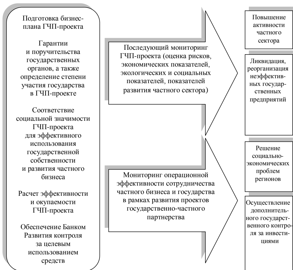
Рис. 2. Алгоритм мониторинга реализации кредитно-инвестиционного механизма в Банках Развития [авторская разработка]

Доказано, что его практическое применение позволит: во-первых, обеспечить рациональное использование государственных средств, выделяемых в рамках развития инфраструктурных проектов; во-вторых, выявить отрасли, нуждающиеся в поддержке государства, и определить базовые показатели выделяемых на их развитие кредитных ресурсов; в-третьих, решить первоочередные социально-экономические проблемы регионального значения с учетом стратегических интересов государства и частного бизнеса; в-четвертых, сформировать статистическую базу по уже реализованным ГЧП-проектам с целью минимизации будущих рисков по инфраструктурным проектам государственного значения.