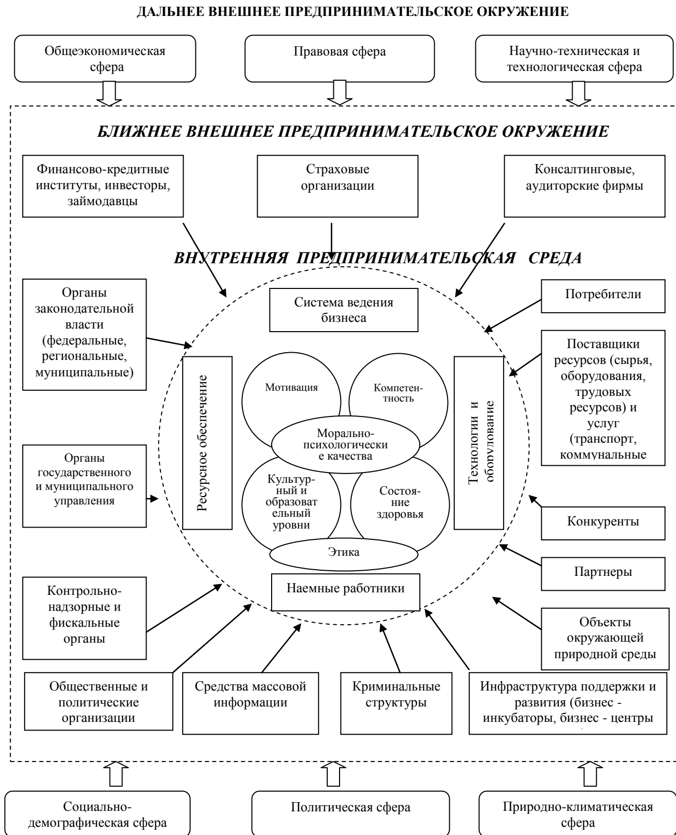
Рис. 2. Состав и взаимодействие основных элементов внешней дальней, ближней и внутренней среды индивидуального предпринимателя.

и внутренней среды индивидуального предпринимателя представлены на рис.2.