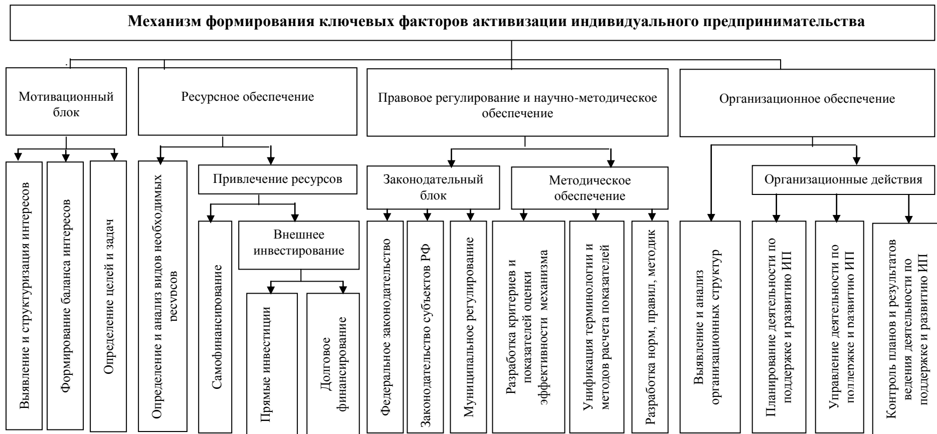
Рис. 3. Схема структурных составляющих механизма формирования ключевых факторов активизации индивидуального предпринимательства.