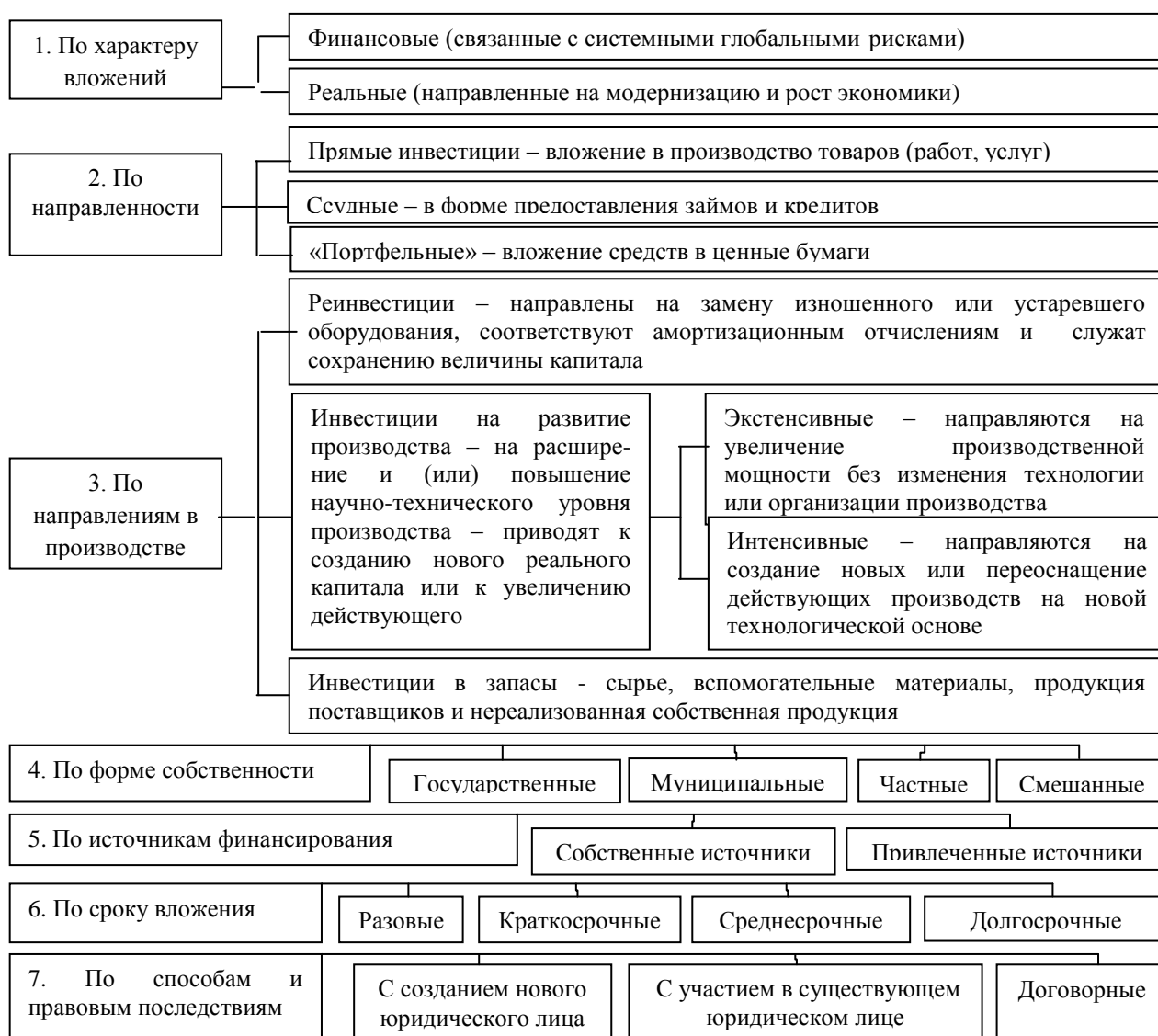
Рисунок 1 – Классификация инвестиций

Раскрыта специфика основных методов развития финансового механизма регулирования инвестиционной деятельности на основе эмиссионно-инфляционной зависимости, сбалансированности внешнеэкономической политики, оптимизации уровня совокупного налогообложения, ставок рефинансирования, условий кредитования, а также активизации привлечения сбережений населения для инвестиционной деятельности.